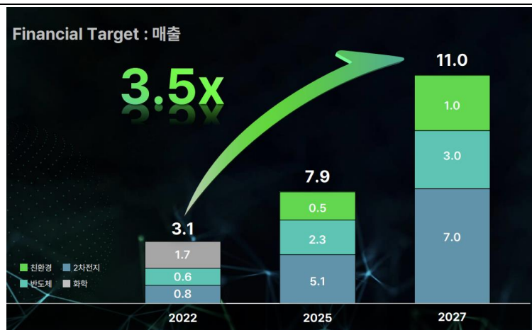
[그림1] SKC의 중장기 매출 목표